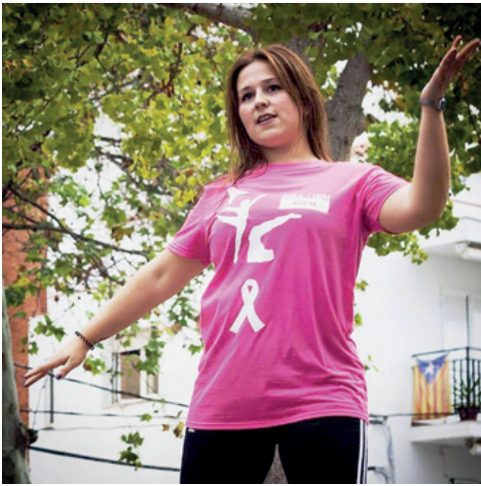
Ballant pel Dia Mundial contra el Càncer a Ribes.

Pel Carnaval sempre he estat més a Sitges, des dels catorze anys. M'agrada molt l'ambient de les colles i del ball, i m'he trobat i estic molt contenta de formar part de la colla A saco.