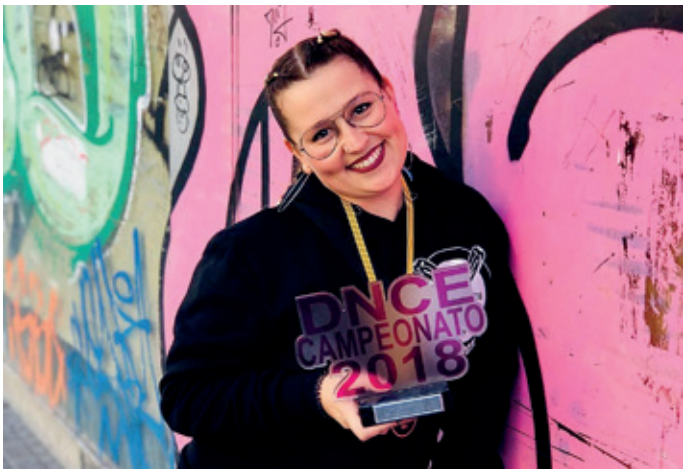
Premi del Campionat de dansa urbana de 2018.