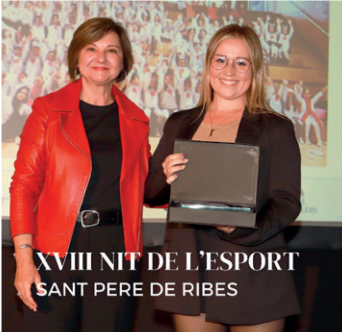
Nit de l'Esport. agraïment pels 5 anys formant ballarins.

El meu propòsit és continuar com fins ara, contenta i feliç amb la meva feina i la gent que m'envolta!