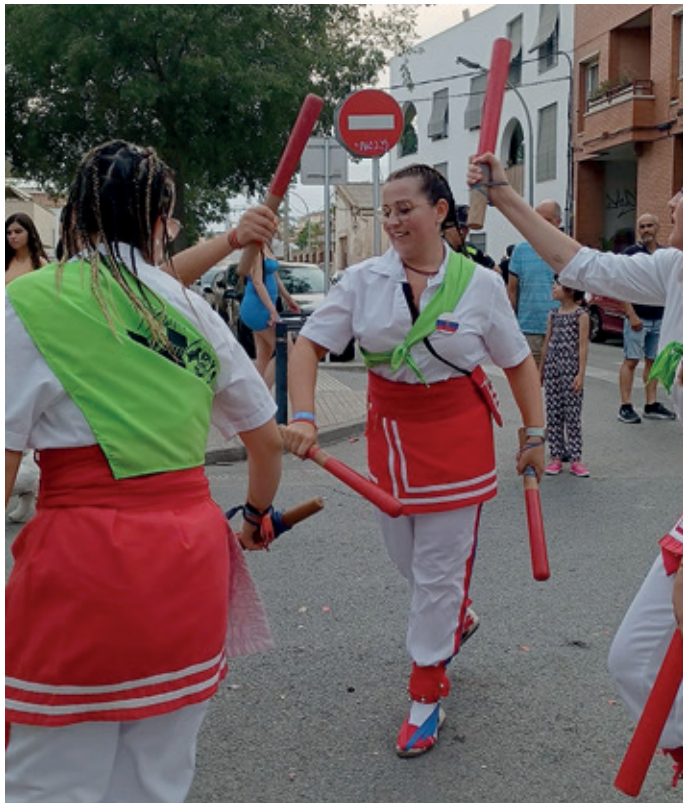
Durant la Festa Major, amb la colla de Bastons.

“Amb quinze anys, ja havia fet a més de clàssic, modern i flamenc”