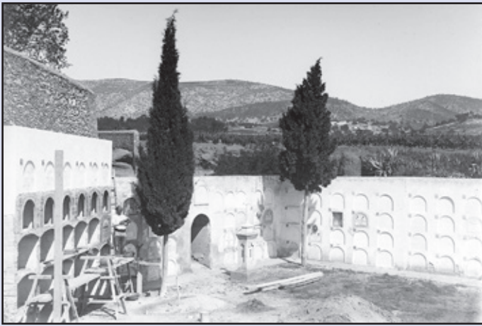
Construcció dels nínxols de la part vella del cementiri l'any 1893