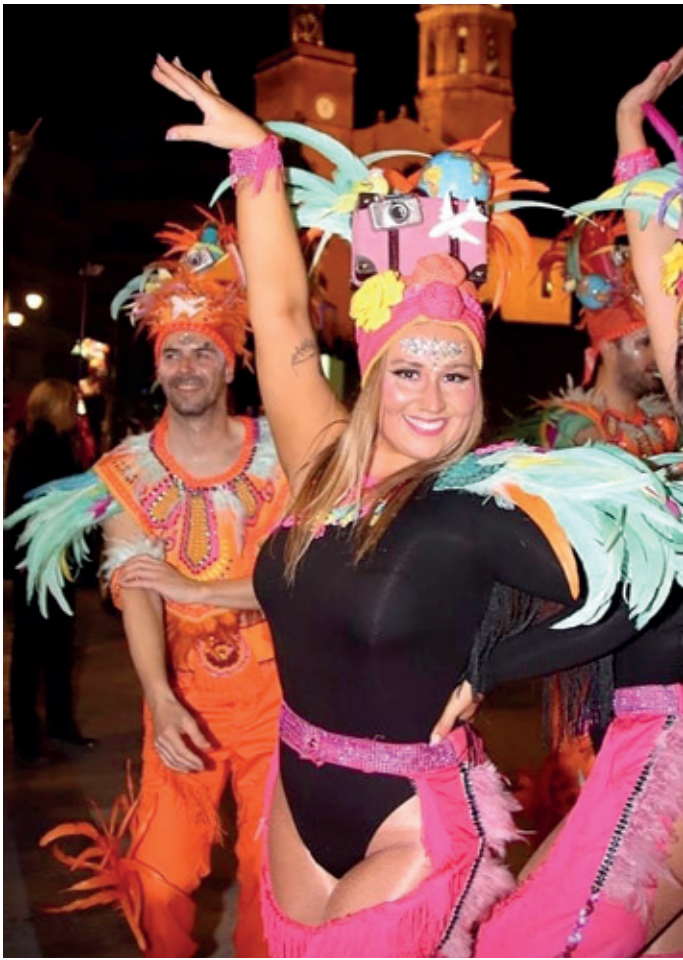
Feliç, durant el Carnaval de Sitges.