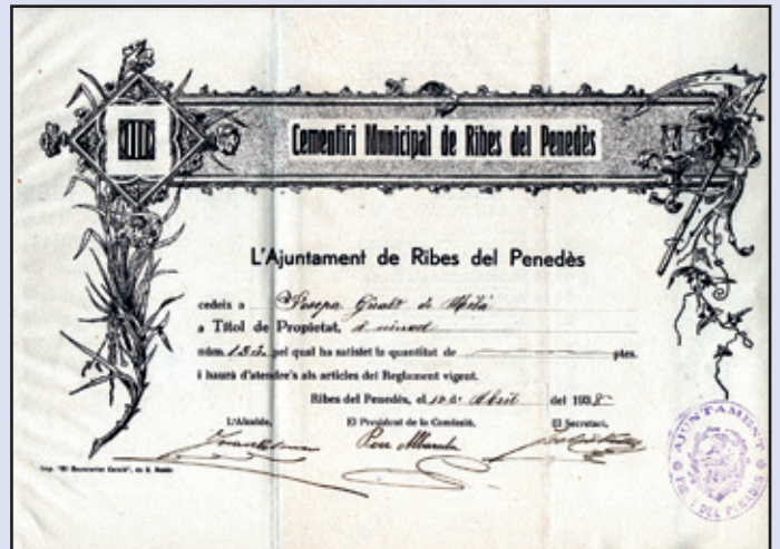
Títol de propietat d'un nínxol del Cementiri Municipal de Ribes del Penedès de l'any 1938, en temps de guerra (Col·lecció de can Janet d'en Zidro)

Els primers dies de la guerra mossèn Ramon va ser